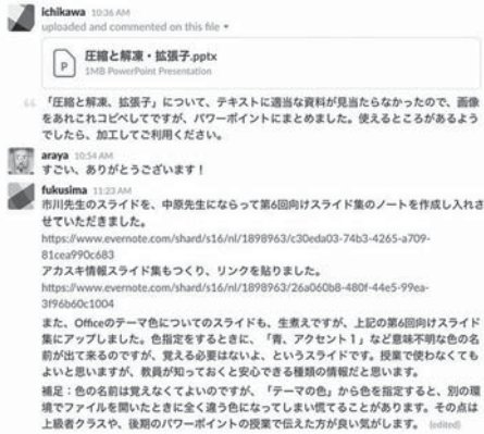
図2 貢献度の明示化

しかし、担当教員間でのICTを活用した「コミュニケーション・メディア」の確立は、誰が、いつ、どのような作業によって、いかなる教育効果をもたらしたかということが誰の目にも明らかに示される。オンライン上でのテキストチャットをベースにしたコミュニケーションにおいては、発言履歴が残されるため、実際の作業現場の教員の努力