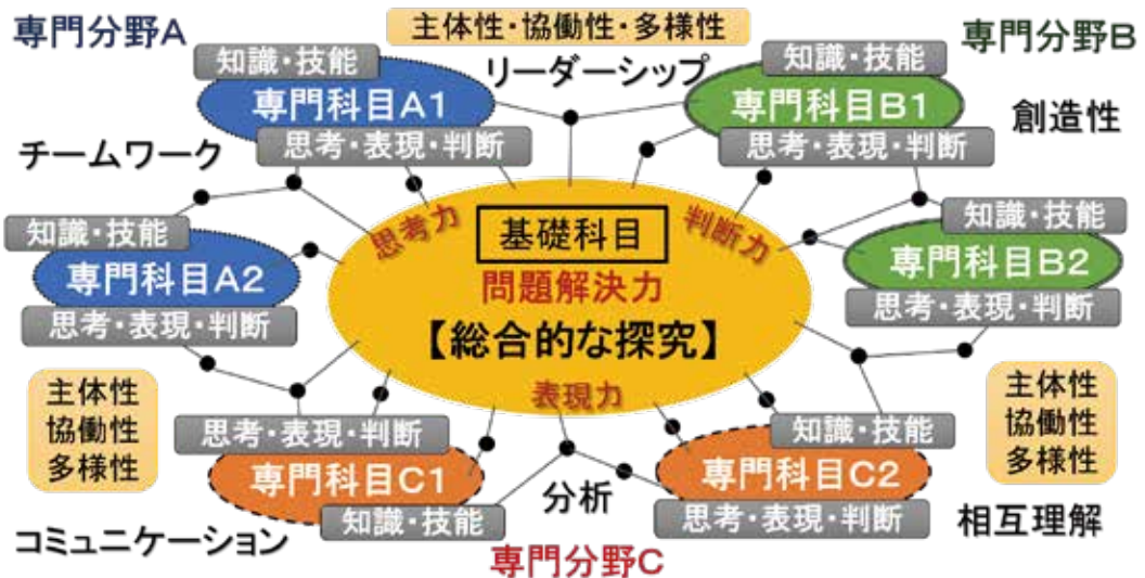
図3 資質・能力を軸にしたカリキュラムの俯瞰図

文系情報学科のカリキュラムを開発するためには、情報教育と情報処理教育は、一般教育と専門教育という意味で異なることを意識する必要がある。また、一般教育は専門教育の入門編ではないということを前提としなければならない。各科目において一般教育と専門教育をどう切り分け融合するかということが重要になるが、問題解決の縦糸・横糸モデルのどこに重点を置くかということで問題が解決できる。