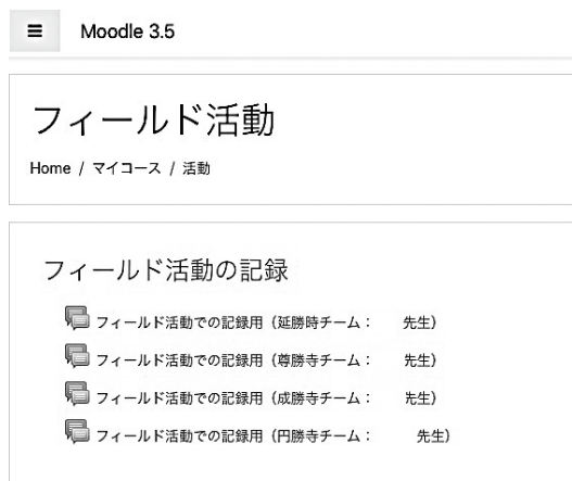
図5 フォーラムの画面

研修に先立ち MacBook Air (以下、Mac と表記) の MAC アドレスを登録し、DMZ 機能を持つモバイル Wi-Fi ルータ (以下、DMZ ルータ) に接続できるように設定した。また、DMZ ルータ側では、Mac にグローバル IP を割り振るように設定した。次に、Mac 上に moodle を導入、研修用コースを作成、そして「フォーラム」を加え、フィールド活動での目標物の「碑」の名称を目印にしたスレッドを作成した (図5)。さらに、活動する班数+予備のユーザを作成した。